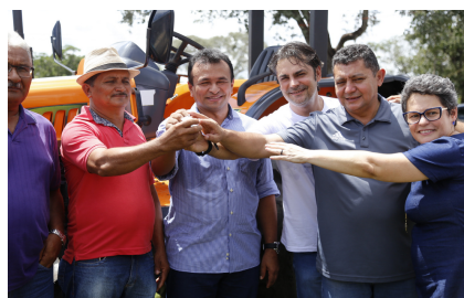
ENTREGA DE TRATOR E IMPLEMENTOS AGRÍCOLAS