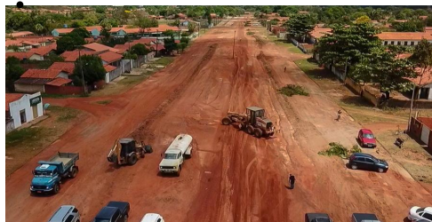
AVENIDA GOVERNADOR LUCÍDIO PORTELLA