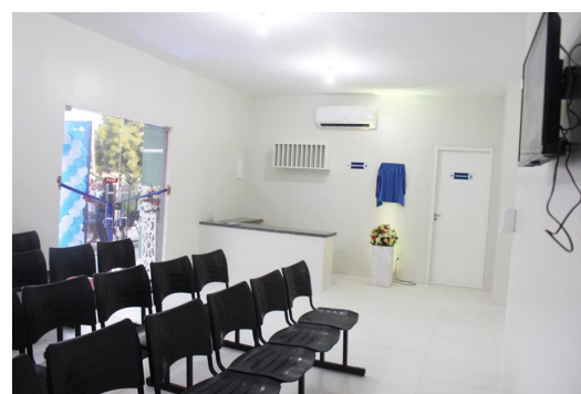
UNIDADE BÁSICA DE SAÚDE DE JOSÉ DE FREITAS