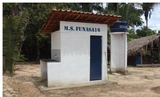
CONSTRUÇÃO DE BANHEIROS NA ZONA RURAL